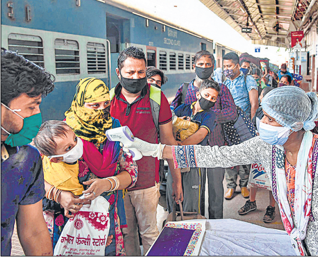
पटना में मुंबई से आए प्रवासियों की जांच करती एक चिकित्साकर्मी। फ्रेड

दो महीने से ज्यादा लंबे लॉकडाउन के बाद आज से तमाम तरह की व्यावसायिक गतिविधियां व आवाजाही शुरू हो रही है... रविवार को रिकॉर्ड 8380 नए मामले सामने आए, इसके साथ ही देश में संक्रमित मरीजों की कुल संख्या 182,143 तक पहुंच गई।